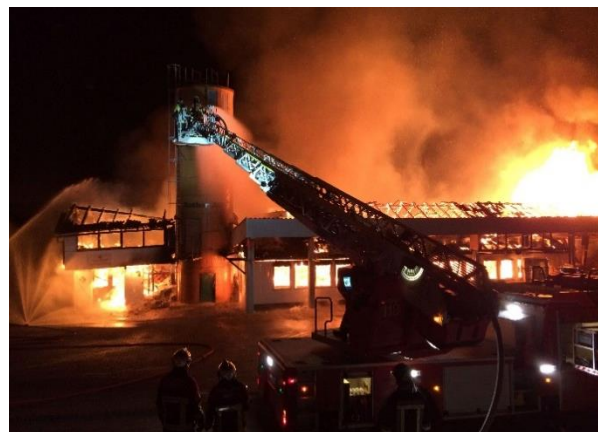
Bilder Medienmitteilung Kantonspolizei Bern (Brand Höhlen Lanzenhäusern)

Bei Öl- und Verkehrsunfällen sind wir dieses Jahr 10 Mal ausgerückt. Solche Ereignisse sind immer sehr speziell. Man weiss nie, was für eine Situation einem erwartet. Man trifft manchmal sehr unschöne Bilder an und die Betei-